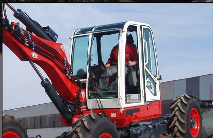
Vetri anteriori in Lexan Front glasses in Lexan Vitres avant en Lexan