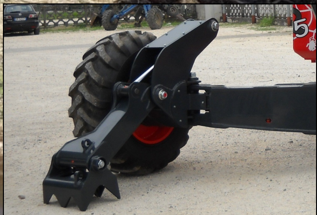
2 piedi articolati sulle ruote anteriori 2 jointed feet on the front legs 2 pieds articulés sur les pattes avant 2 große Gelenkfüße auf vorderrädern