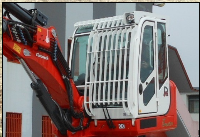
Griglia di protezione per cabine Protection of the cabin Grille de protection cabine Schutzgitter der Kabine